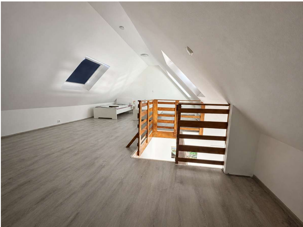
Oberer Wohn-/ Schlafbereich