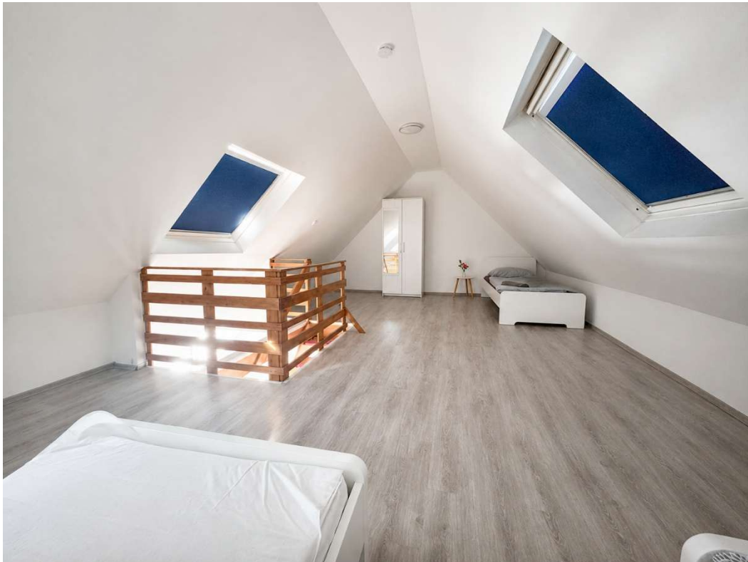
Oberer Wohn-/ Schlafbereich