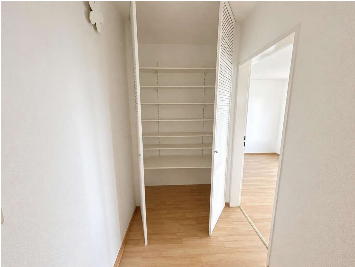
Wandschrank im Flur